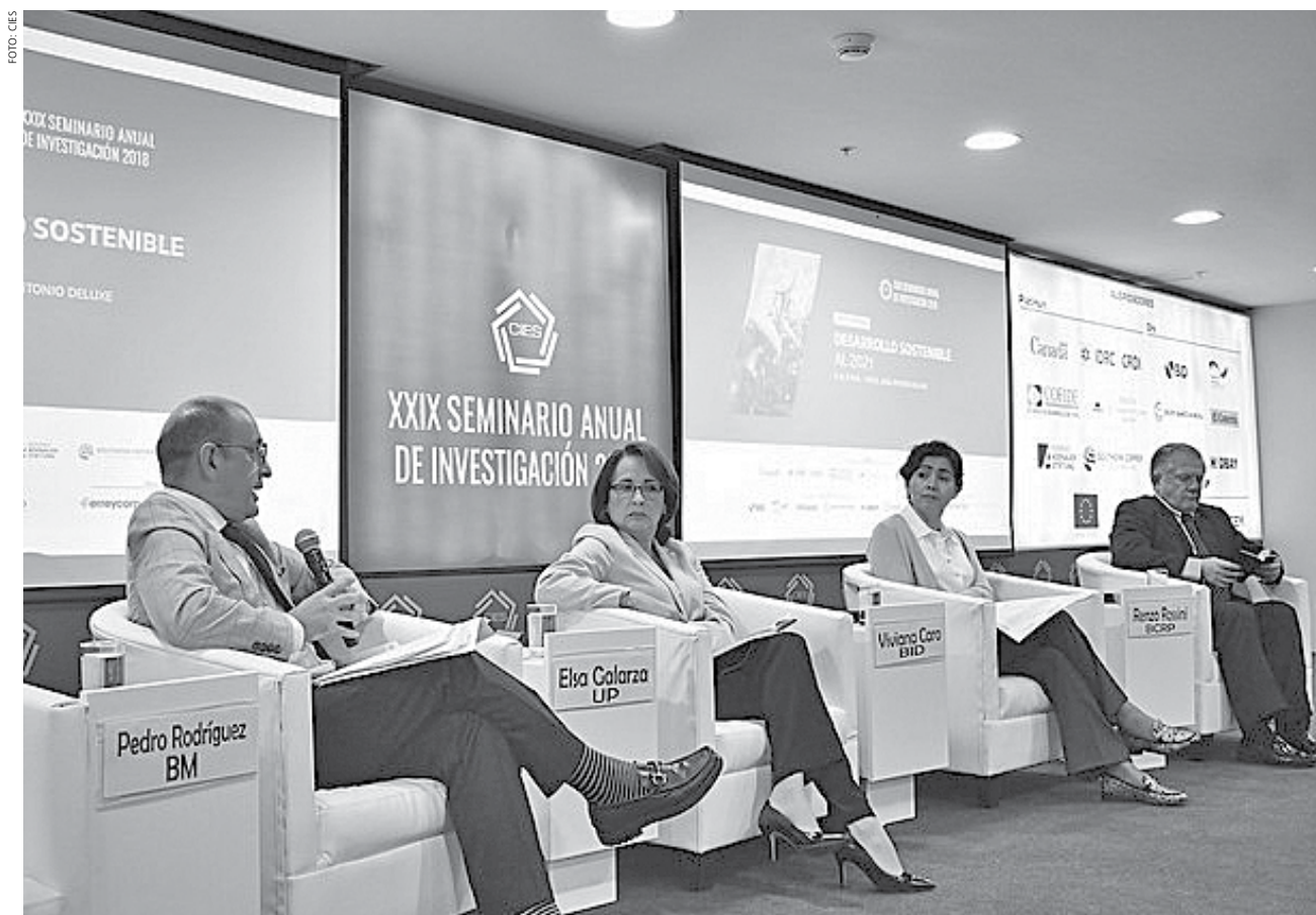
Los panelistas coincidieron en la necesidad de impulsar un desarrollo económico sólido y sostenible, con fundamentos de largo plazo.

La economía peruana viene mostrando señales de recuperación, y se prevé que en los próximos años crecerá por encima del 4%. El reto, sin embargo, sigue siendo cómo lograr que el desarrollo sea sostenible en el tiempo. Para los panelistas de este evento público, la clave está en trabajar en la competitividad de las actividades productivas, y en ese camino, la sostenibilidad ambiental tiene que ser un elemento imprescindible.