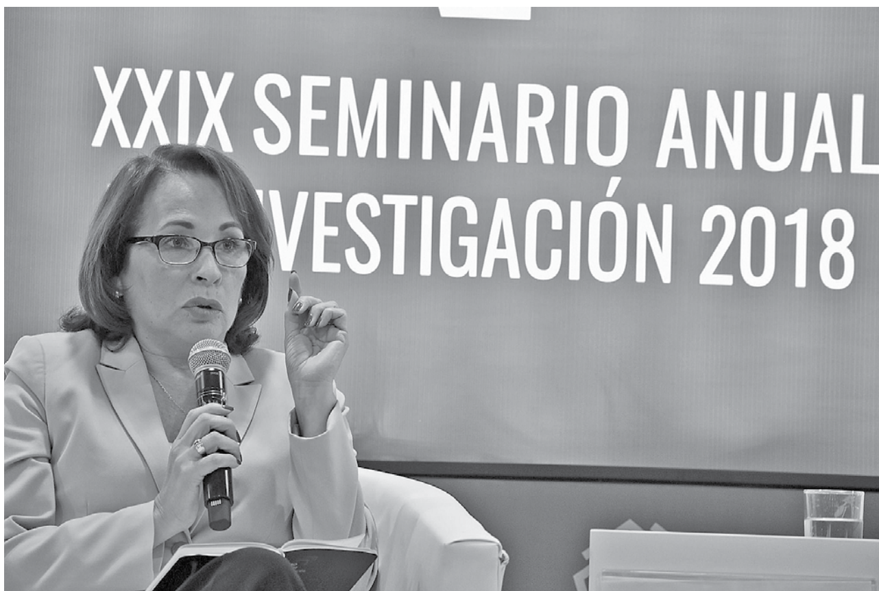
Según Elsa Galarza, exministra del Ambiente, los temas ambientales no pueden seguir siendo un apéndice de las políticas.

alcanza al 21% de peruanos; es decir, cerca de siete millones de personas se encuentran en condición de pobreza. Sumado a ello, Rodríguez señaló que entre 2016 y 2017, el gasto promedio mensual de hogares peruanos bajó de S/734 a S/732, y en el quintil más pobre, se redujo de S/267 a S/264. “Si bien parece una reducción menor, debemos tomar en cuenta que la canasta básica de un hogar es de S/338. Además, hay que agregar que una proporción importante de la población está al borde de deslizarse en el abismo de la pobreza”, precisó.