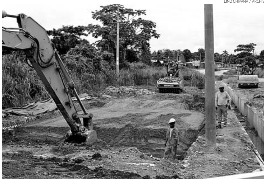
LINO CHIPANA / ARCHIVO

Esta es una barrera para la entrada de nuevas y grandes empresas, que además obliga a las industrias afinadas a paralizar sus inversiones de expansión regional. Por poner un ejemplo, la entrada de una gran empresa lechera podría consumir casi 4 MW de los 30 MW (promedio) que en total se producen en la región.