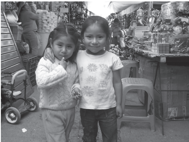
Los resultados encontrados muestran que las transiciones hacia la pobreza o fuera de ella son intensas.