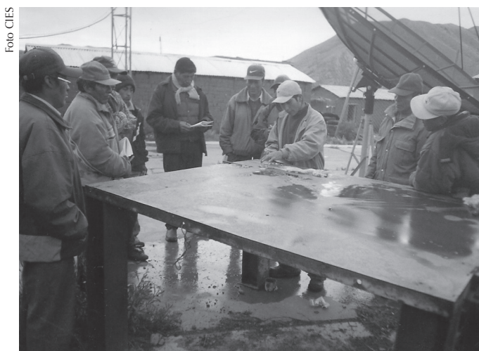
Los trabajadores con contrato permanente tendrían una condición superior en 0.36% con respecto a los trabajadores sin contrato; mientras que los trabajadores con contrato fijo tendrían un ingreso superior en 0.3% con respecto a los trabajadores sin contrato.

En lo referente a la reducción de la pobreza por tipo de contrato, las mayores reducciones ocurrieron para los trabajadores con contrato fijo (3.80%), seguidos de los trabajadores sin contrato (3.6%) y los trabajadores nombrados o con contrato indefinido (2.02%). Estas reducciones se explican en un 97.36% por la varia-