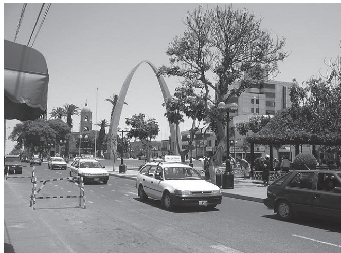
A nivel nacional, Tacna es el departamento que tiene la tasa de pobreza más baja; mientras que Apurímac es el segundo departamento con el mayor porcentaje de pobres.

El crecimiento de la economía peruana en las últimas décadas y las políticas sociales han contribuido a la reducción de la pobreza en el Perú de 46.8%, en el año 2004, a 34.48%, en 2008. A nivel de la Macro Región Sur 2 , las estadísticas de la Encuesta Nacional de Hogares (ENAH) muestran una reducción importante en la tasa de pobreza de 54.03% (en el año 2004) a 46.48% (en el año 2008). Sin embargo, las tasas de pobreza en los departamentos localizados en la sierra, como Apurímac (68.97%), Puno (62.80%) y Cuzco (58.81%), son altas y mayores con respecto a los departamentos de la costa y selva. Por ámbito geográfico, en el urbano el porcentaje de pobres es de 27.24%; mientras que en el rural el porcentaje es de 65.23%. En el ámbito rural, los departamentos con los mayores niveles de pobreza son Apurímac (74.10%), Puno (72.94%) y Cusco (68.20%). Por dominio geográfico o región natural, en la sierra el porcentaje de pobres es de 52.27%, en la selva de 23.08% y en la costa de 17.18%. Estos resultados sugieren que es importante realizar un análisis del comportamiento de la pobreza y los factores que explican.