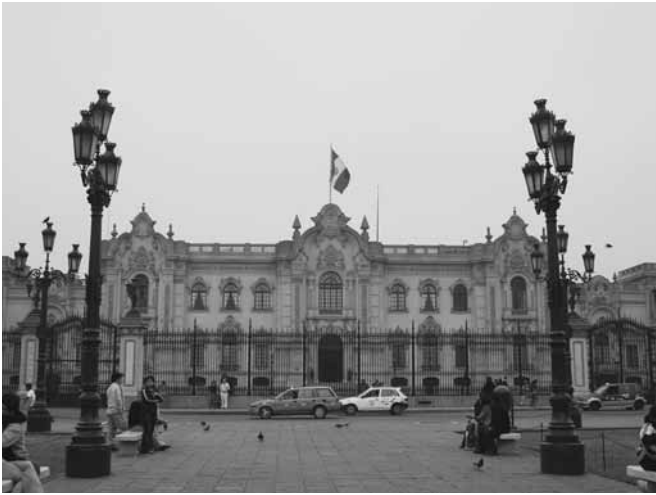
Existe un reto fundamental: definir qué se entiende por “governabilidad” y qué se entiende por “gestión pública”.

se entiende por “gestión pública”, ya que se pueden tener ideas diferentes sobre estos conceptos y no llega a quedar claro qué se quiere lograr con esto. Asimismo, en cuanto a lo que significa “gestión pública” remarcó que también debe hacerse un esfuerzo adicional para entender qué tipo de problemas se consideran en esta temática y qué tipo de investigación es la que se necesita.