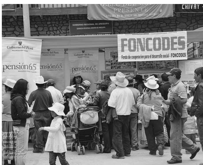
En cuanto al capítulo de pobreza, éste se aborda de forma adecuada, aunque quedan por trabajar los temas asociados a la problemática de la distribución del ingreso.