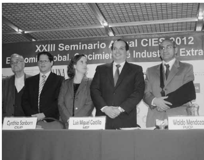
El titular de Economía señaló mejorar la calidad de vida de los ciudadanos, con un simple acceso a agua, a electricidad, en las zonas rurales del país, definitivamente va a marcar la diferencia de ser o no ser un Gobierno exitoso.