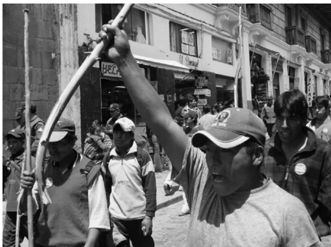
Las acciones orientadas a fortalecer el rol de este como administrador de los recursos naturales o mejorar las condiciones socio-ambientales y hacerlas exigibles, especialmente en relación con las actividades extractivas, es tarea urgente.

coordinación. Asimismo, fortalecer el ejercicio descentralizado para la gestión ambiental y el manejo de los recursos naturales, bajo el principio de subsidiariedad en la gestión.