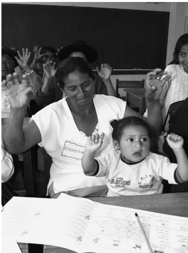
No hay una estrategia para el desarrollo infantil temprano, la mejora de los aprendizajes luego del segundo grado, o la reducción de las brechas que afectan a las poblaciones con necesidades educativas especiales (estudiantes indígenas o con discapacidad).

Llevado a escala nacional el desarrollo de modelos de acompañamiento pedagógico e intercambio de experiencias entre docentes para promover mejores aprendizajes; se ha triplicado la cobertura de educación inicial formal para niños de 3 a 5 años de edad; asimismo se ha establecido la Evaluación Censal de Estudiantes (ECE) para medir los logros de aprendizaje y se ha mejorado significativamente los logros de aprendizaje en segundo grado. Sin embargo, el PELA es el único Programa Estratégico para mejorar los logros de aprendizaje y solo abarca los ciclos II