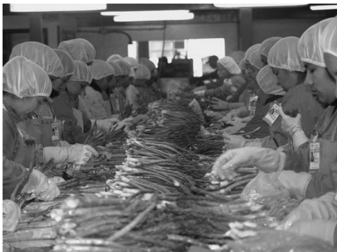
La otra cara de la moneda es lo que las empresas pueden hacer por sí mismas para impulsar el modelo de crecimiento económico del país.

preocupa la vulnerabilidad del Poder Judicial ante los intereses particulares, así como la capacidad de las instituciones para promover la competencia y desalentar las prácticas desleales o discriminatorias.