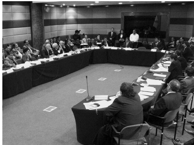
Se considera que los temas fundamentales para una transformación productiva del país están puestos sobre la mesa.

«La globalización, de la que formamos parte, impone una condición al tipo de crecimiento que deseamos mantener: la apertura económica y la integración al mercado internacional»