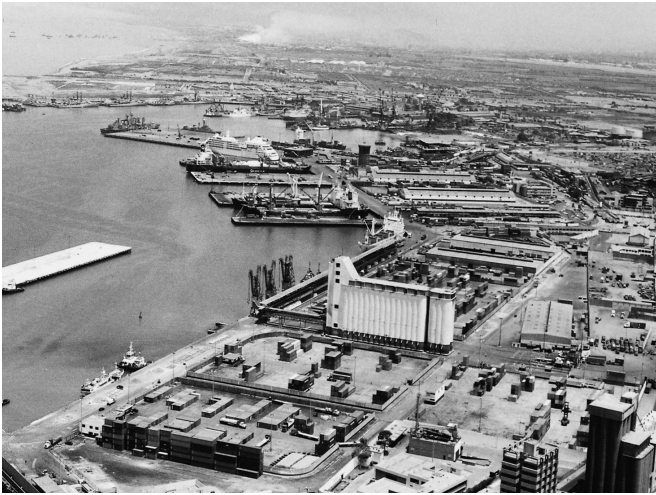
El empresario con un sentido práctico ve las cosas desde la perspectiva de las tareas que hay que hacer y los resultados que hay que lograr.

la informalidad. De esta forma, se apunta al centro de la problemática empresarial y se hace atractiva la tarea de la formalización.