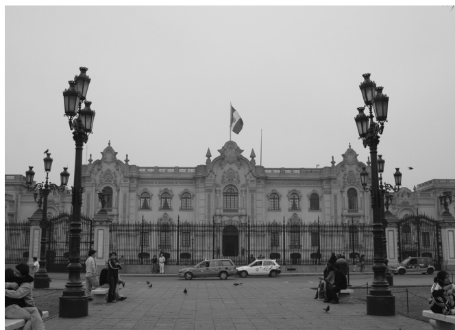
El sector público tiene que ser evaluado en los mismos términos de competitividad y responsabilidad con los que se evalúa a la empresa.