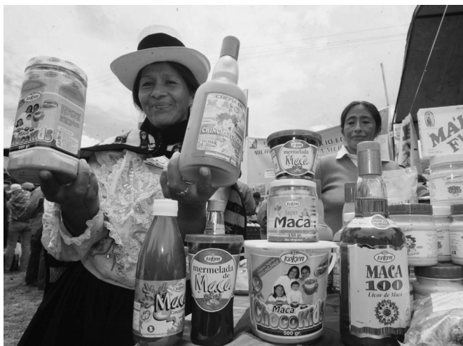
Nuestros logros económicos son muy limeños y bastante costeños. Al modelo le falta capacidad para extenderse geográficamente a lo largo de todo el país.

hecho que las exportaciones sean uno de los motores saludables del crecimiento productivo.