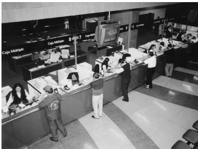
Nuestro sistema financiero todavía tiene puntos débiles que se reflejan en indicadores como alta dispersión en las tasas de interés.