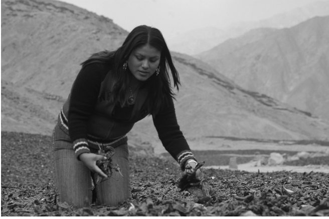
Las mujeres se han concentrado de manera creciente en las industrias orientadas a la exportación (especialmente, la manufactura de baja calificación profesional y el sector exportador agrícola no tradicional).

pero tal tendencia también ha sido propiciada por el proceso de liberalización comercial y de ajuste económico que ha experimentado la región en las dos últimas décadas. La privatización de los servicios, el cambio de los patrones de consumo y el mayor desempleo masculino resultante de las repetidas crisis económicas han contribuido a que los hogares requieran contar con más de una sola fuente de aporte a sus economías. Las mujeres se han concentrado de manera creciente en las industrias orientadas a la exportación (especialmente, la manufactura de baja calificación profesional y el sector exportador agrícola no tradicional) y los sectores de servicios. Pero independientemente de dicha expansión, la remuneración de las mujeres sigue siendo, en promedio, significativamente menor que la masculina (en 2005 estaba 30% por debajo de esta). Más aún, esta cifra encubre diferencias importantes entre las trabajadoras calificadas y no calificadas (especialmente, las empleadas domésticas), así como la variación de país en país. También impide apreciar si esta brecha de género está disminuyendo con el paso del tiempo 12 .