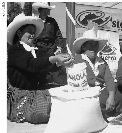
Otra tendencia emergente es el crecimiento de la participación femenina en el sector de pequeñas y medianas empresas.