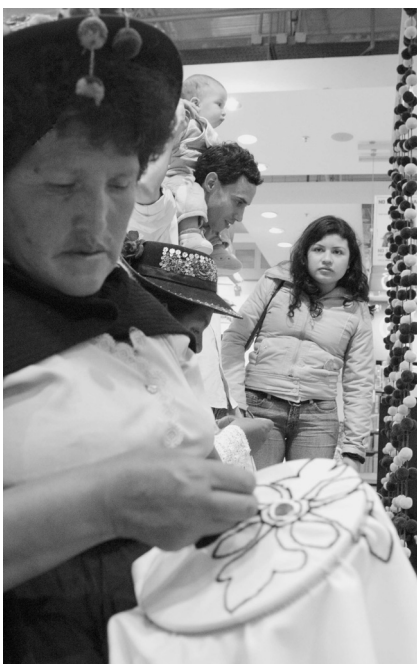
Muchas mujeres que buscan empleo tienden a ingresar al mercado informal de trabajo a domicilio donde pueden combinar el trabajo remunerado para afuera con el trabajo no remunerado.