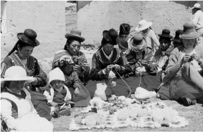
El trabajo del hogar y el cuidado de terceros no remunerado sigue constituyendo uno de los principales factores responsables de la desigualdad entre los sexos.

en vista del significativo crecimiento del empleo femenino en las industrias manufactureras ligeras, intensivas en mano de obra y orientadas a las exportaciones, así como en el sector moderno de servicios en los países en desarrollo—, los detractores de dichas políticas temen que las mujeres probablemente sean más vulnerables a los efectos negativos de la liberalización comercial y tengan una menor capacidad que los hombres para beneficiarse de sus efectos positivos. Sin embargo, está surgiendo un corpus de evidencia empírica que sugiere que la realidad es, de hecho, más compleja y depende en mayor grado de contextos específicos.