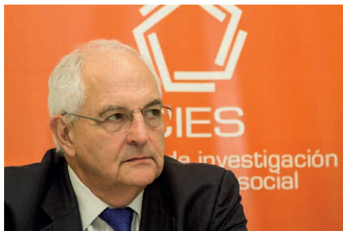
Martin Wolf, Editor asociado y columnista principal del Financial Times ▲

El 6 octubre 2015, el editor asociado y columnista principal del diario británico Financial Times, Martín Wolf, brindó la conferencia magistral "Desafíos de la economía y finanzas mundiales", organizada por la Universidad del Pacífico y CIES. En ella, Wolf afirmó que la economía mundial pasa por un momento muy delicado y que las políticas utilizadas para hacer frente a ella pueden ser desestabilizadoras. El evento contó con la participación del Director de la Maestría en Economía y el Vice Decano de la Facultad de Economía y Finanzas de la Universidad del Pacífico. Por otro lado, Wolf participó de una reunión cerrada con empresarios y representantes de la cooperación internacional.