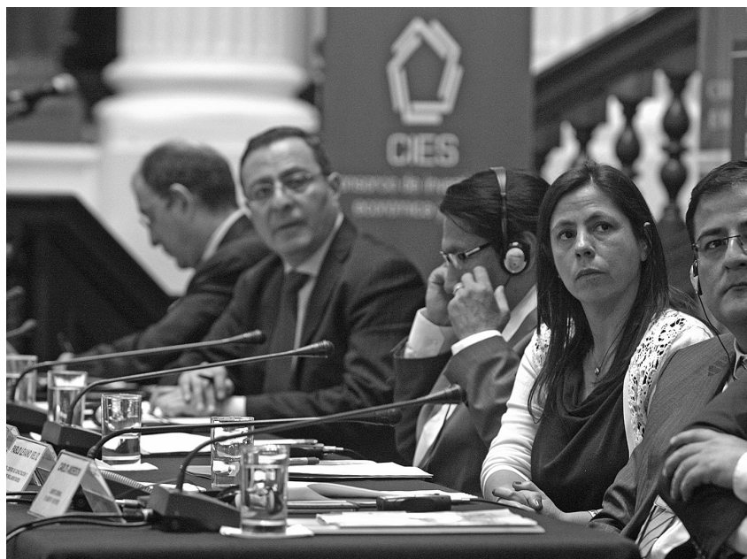
Los comentaristas expusieron sobre los graves problemas que enfrenta el mercado laboral peruano, entre ellos, la informalidad y la baja productividad de una gran parte de la masa de trabajadores.

“Employment prospects and labor market policies”, Pissarides 2015.