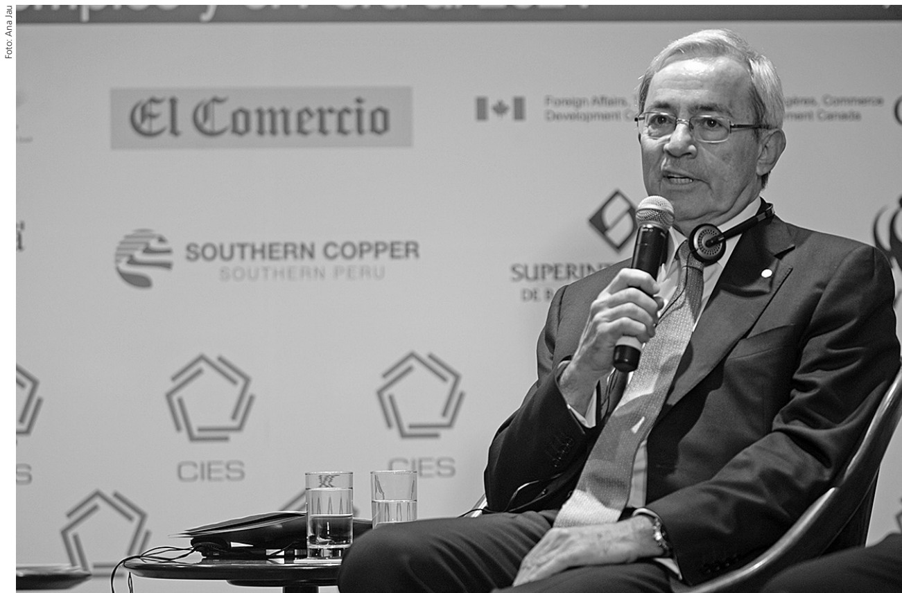
El Dr. Pissarides explicó que la creación de un mercado único en el bloque europeo benefició a sus miembros, pero señala que aún es un proceso no concluido, sobre todo en el sector de servicios.

Como invitado principal del XXVI Seminario Anual del CIES, el economista Christopher Pissarides, ganador del Premio Nobel de Economía de 2010, expuso en Lima sobre “Los desafíos de la Eurozona y sus implicancias sobre la economía mundial y América Latina”. Habló sobre el proceso de formación de la Unión Europea, sus fortalezas y debilidades, así como sobre las dinámicas de integración en América Latina.