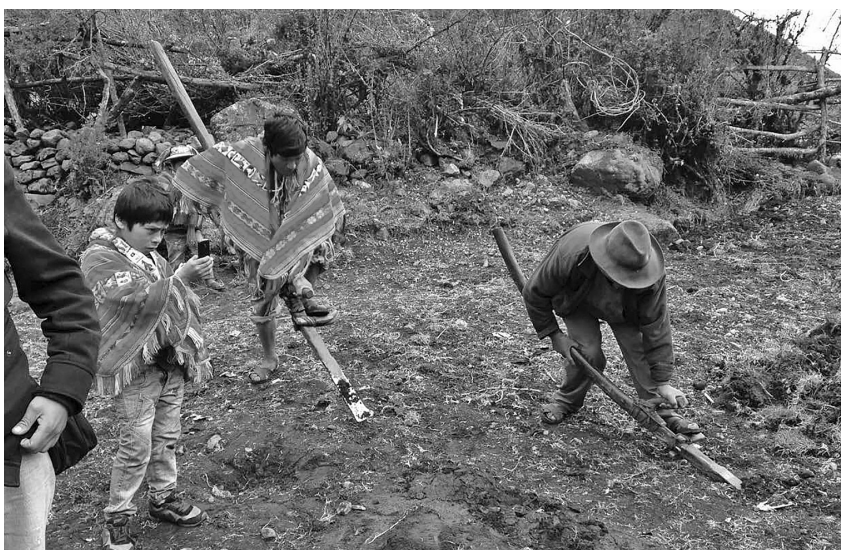
El productor de una pequeña finca es una persona natural, que no emplea en general a personas de manera permanente, y utiliza un tamaño agropecuario que no excede el equivalente de 10 hectáreas de riego de la costa.

El ganado fue convertido en hectáreas de riego de la costa tomando una soportabilidad (la cantidad de ganado que puede haber en una cierta área de pastoreo) anual de 40 unidades ovino por hectárea de riego de la costa dedicada a cultivos forrajeros, según estimaciones de la cantidad de materia seca obtenible anualmente por hectárea de cultivos forrajeros de la costa. Se considera un requerimiento de 500 kg/año de materia seca por unidad ovino.