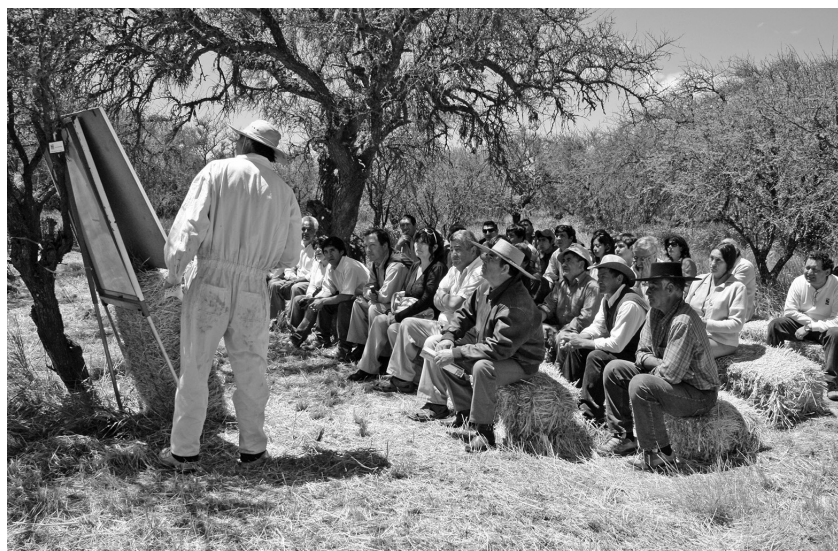
En promedio, el nivel educativo de los pequeños agricultores es de 5,75 años aprobados, lo cual no varía en gran medida si el tamaño de la finca es excedentaria.

la finca típica está definida por el valor promedio de una serie de variables; estas variables incluyen las usadas para la zonificación y para la tipificación, así como otras variables (p. ej., la superficie cultivada de cada cultivo o el número de cabezas de cada tipo de ganado). Estos perfiles constituyen “modelos de finca”, cuyos parámetros variables (por ejemplo, rendimientos y precios) pueden ser valorados año tras año para originar indicadores acerca del comportamiento del sector agropecuario (especialmente las fincas PAF) por tipo de finca y por microrregión.