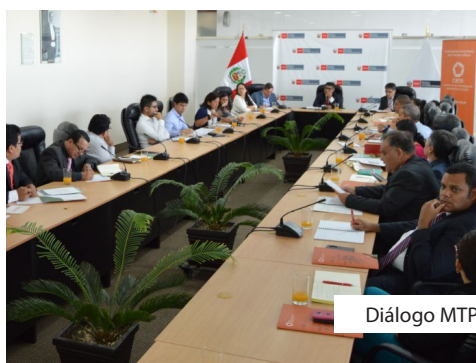
Diálogo MTPE (08/03)