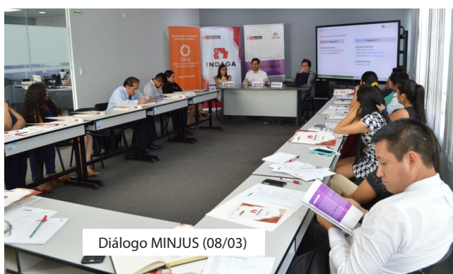
Diálogo MINJUS (08/03)