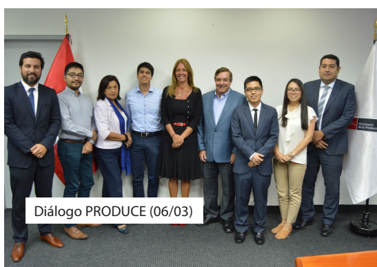
Diálogo PRODUCE (06/03)