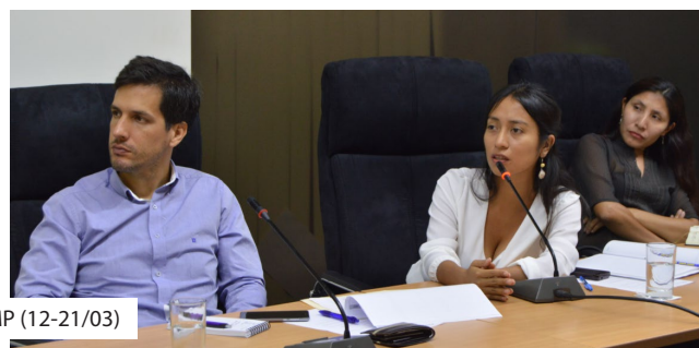
Diálogos MIMP (12-21/03)