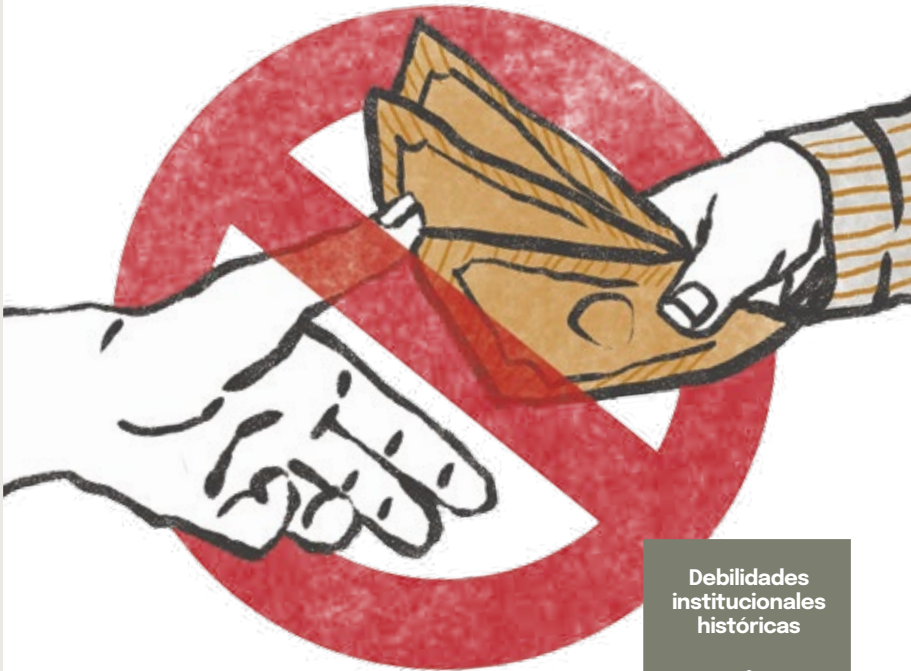
Perú: preocupación por la corrupción (%) y tolerancia promedio a conductas corruptas (%).