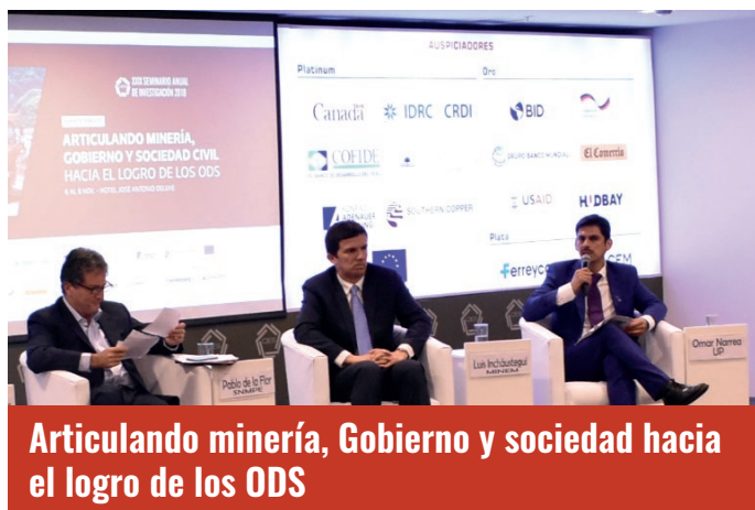
Articulando minería, Gobierno y sociedad hacia el logro de los ODS

Seis eventos públicos sobre temas clave de actualidad: transparencia, ética y corrupción; violencia de género; minería y gobierno hacia los ODS; desarrollo sostenible al 2021; investigación y políticas públicas