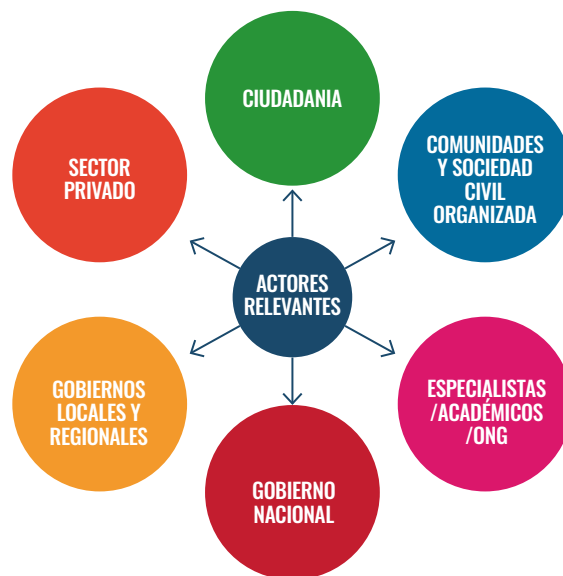
GRÁFICO 4 Actores relevantes para el recojo de información.

¿Las fuentes se hacen similares con respecto a abordar cualquier otra temática de interés social? El propósito del diagrama es aterrizar en que los temas de los Objetivos de Desarrollo Sostenible no están fuera de los temas que se tratan todos los días en la actividad periodística, lo clave está en el enfoque.