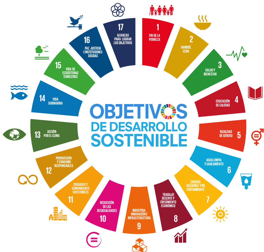
Imagen Referencial de los 17 Objetivos

Incluso la Visión del Perú al 2050, aprobada el 2019 por el Foro del Acuerdo Nacional, toma en cuenta los cinco ejes centrales de los ODS; en las que se encuentra temáticas relacionadas al potencial de las personas, la educación, la salud universal, protección del medio ambiente, desarrollo sostenible con empleo digno, respeto por los derechos fundamentales y un estado moderno, transparente y libre de corrupción.