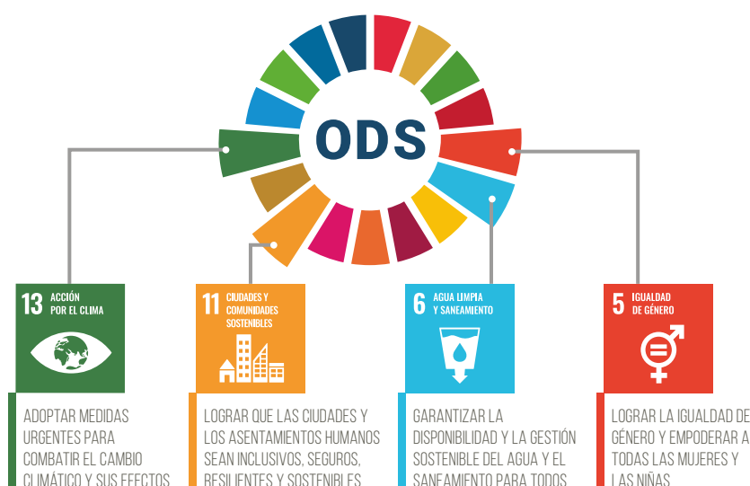
GRÁFICO 3 Objetivos de Desarrollo Sostenible 5, 6, 11 y 13.

Es importante destacar que, en Perú, el documento elaborado por las Naciones Unidas (2021), denominado El Sector Empresarial y los Objetivos de Desarrollo Sostenible en el Perú compila indicadores claves respecto al ODS 5 referido a la igualdad de género. El documento señala que el 54.8 % de las mujeres declararon haber sufrido alguna vez en su vida violencia por parte de su pareja. Según reportes de la Línea 100, el 2020 las denuncias de violencia doméstica aumentaron a 97%. Respecto a la brecha salarial, se ha detectado una reducción del 35% al 26% entre los años 2008 y 2019. En el 2018 se reportó que más de 56,000 adolescentes peruanas viven en uniones y matrimonios tempranos, mientras que el 70% de las niñas y adolescentes que se unieron entre los 10 y 15 años viven en áreas rurales.